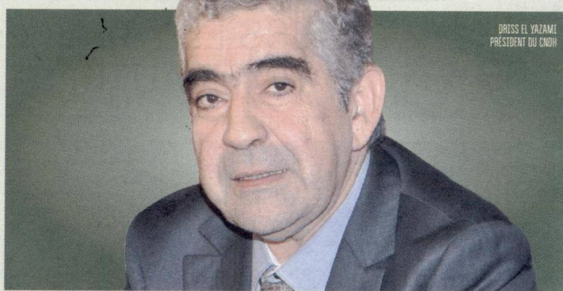
DRISS EL YAZAMI PRÉSIDENT DU CNDH