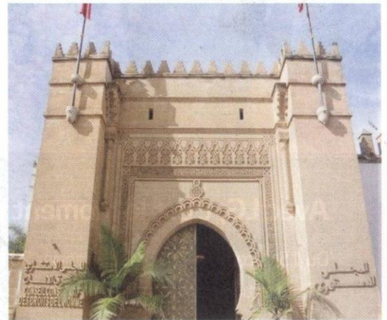
Le livre pédagogique est ancré dans le contexte marocain, marqué par la consécration du référentiel universel des droits de l'Homme.

De son côté, la représentante de la sous-directrice générale pour les sciences sociales et humaines, Unesco, Golda El Khoury, a affirmé, lors de la cérémonie de présentation de ce manuel, que le Maroc a réalisé de grandes avancées en matière des droits de l'Homme. Soulignant la volonté de son organisation de «porter l'expérience atypique accumulée par le Maroc en matière de droits de l'Homme vers des pays arabes faisant face à de grands défis dans le do-