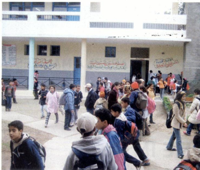
Le projet de loi 19-22 ne fait pas l'unanimité.

A lors le projet de loi 19-12 sur les conditions de travail et d'emploi des travailleurs domestiques fait toujours l'objet d'âpres débats au sein de la commission des secteurs sociaux à la Chambre des représentants, l'Observatoire national des droits de l'enfant (ONDE) vient de rendre public un communiqué où il appelle les parlementaires à ne pas voter en faveur de cette loi. Considérant ce texte, dans son volet relatif aux enfants, comme un moyen légal encourageant l'exacerbation du travail domestique des enfants, son adoption «serait, selon l'Observatoire, un grand choc et une immense déception pour les militants qui se sont dévoués, depuis l'adoption par notre pays de la Convention onusienne il y a 25 ans et même avant, à protéger les droits de nos enfants pour l'éducation, la sécurité et l'égalité des fils et filles pauvres et aisés pour leur avenir à tous». Dans un communiqué parvenu vendredi à la MAP, l'ONDE a exhorté les députés à faire en sorte que le projet de loi 19-12 stipule formellement «l'interdiction d'employer des personnes âgées de moins de 18 ans». Bien avant l'ONDE,