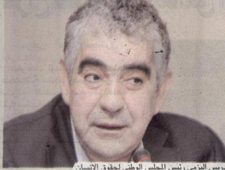
إدريس اليزمي رئيس المجلس الوطني لحقوق الإنسان