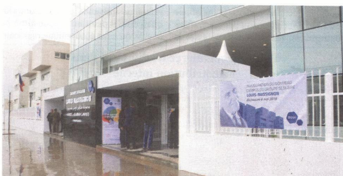
Le groupe scolaire Louis Massignon a démarré ses activités au Maroc en 1996 avec 190 élèves. L'enseigne en forme désormais plus de 4.000 avec son nouveau campus

DANS la ruée des missions étrangères sur le marché marocain de l'enseignement privé, c'est sans doute l'un des plus gros investissements jamais réalisés jusque-là sur ce segment. L'enseigne casablancaise Louis Massignon marque ses 20 ans de présence sur le marché marocain pour livrer un campus d'envergure, joutant la forêt de Bouskoura. Les chiffres parlent d'eux-mêmes: 7 hectares de superficie globale dont 43.000 m 2 de bâtiments aux normes HQE. Le tout, pour un investissement de près de 300 millions de DH. Le site abrite deux établissements primaires, un collège et un lycée, d'une capacité totale de 3.500 élèves. Les premiers seront accueillis dès la rentrée prochaine. L'enseigne totalisera à terme plus de 4.000 élèves à partir de ces trois sites. Ce projet sera le vaisseau amiral du