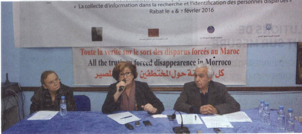
Le comité des familles des disparus et des victimes de disparition qualifie le bilan de la réparation communautaire de mitigé.