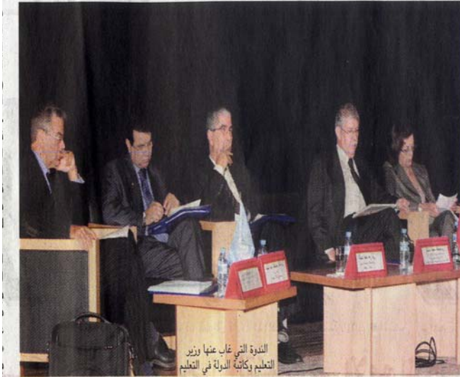
الندوة التي غاب عنها وزير التعليم وكاتبة الدولة في التعليم