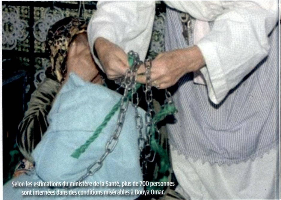
Selon les estimations du ministère de la Santé, plus de 700 personnes sont internées dans des conditions misérables à Bouya Omar.

●● niveau local que national. En chiffres, Bouya Omar recevrait, chaque année, des centaines de visiteurs, qui viendraient se recueillir devant la tombe du marabout. Les frais d'hébergement des malades rapportent à eux seuls près de huit millions de dirhams. Dans le Rapport publié mercredi dernier, le ministère de la Santé préconise la construction d'un centre médico-social moderne dans un délai de deux ans, qui remplacera Bouya Omar. Partant, il a été appelé au lancement d'une vaste campagne de sensibilisation auprès de la population, afin de préparer l'opinion publique à la fermeture de ce site. Le ministre de la Santé a notifié que, depuis 2012, le Gouvernement a décidé de faire de la santé mentale une priorité. Dans cette dynamique, El Hossein El Ouardi a rappelé que cinq nouveaux services de psychiatrie et cinq centres de désintoxication ont vu le jour, outre la formation de 157 infirmiers spécialisés en 2013. El Ouardi a, par ailleurs, annoncé que trois nouveaux centres psychiatriques à Al-Hoceima, Fès et Agadir étaient en cours de construction. Selon les estimations du ministère de la Santé, la mise en place d'un centre médico-social en remplacement du Mausolée Bouya Omar à Marrakech nécessiterait une enveloppe budgétaire de l'ordre de 25 millions de dirhams. Ce nouveau centre, d'une capacité de 120 lits et qui garantirait l'accueil, le traitement et la réinser-