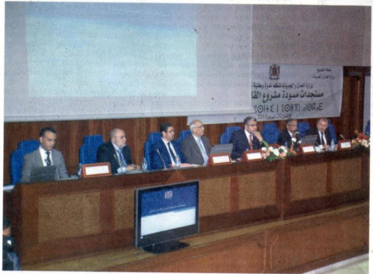
Le projet de réforme du Code pénal fait l'objet d'un large débat.