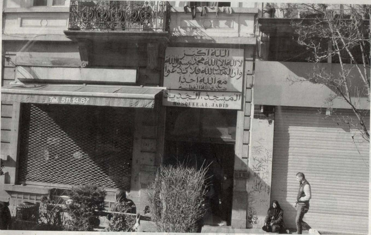
مسجد شيعي ببروكسيل

من هم المغاربة الشيعة في بروكسيل؟ كم عددهم؟ ماهي مساجدهم؟ وما الذي أغراهم للتحول من المذهب السني المالكي إلى التشيع؟ في هذا التحقيق زارت «أخبار اليوم» أحد مساجدهم في منطقة أندرليخت، في بلجيكا، وتحدثت مع مغاربة من رواد هذا المسجد عن سر إقبالهم على التشيع، وهل ولاؤهم لإيران وجذب الله أكبر من ولائهم للمغرب.