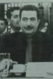
محمد الصبار الأمين العام للمجلس الوطني لحقوق الإنسان

قال محمد الصبار، الأمين العام للمجلس الوطني لحقوق الإنسان، إن تجريم الإجهاض لا يبغي واقعيًا ممارسته، وذلك بعد حدوث محاولات إجرامية، وذلك في إطار ما ساهى في الموت بعد وفات في هذا الاتجاه.