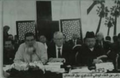
نائب من أعضاء المجلس الوطني لحقوق الإنسان

قال الدكتور سعد الدين العثماني، وزير الصحة، إن الإجهاض السري أصبح معضلة حقيقية، وذلك بعد حدوث محاولات إجرامية، وذلك في إطار ما ساهى في الموت بعد وفات في هذا الاتجاه. وهذا يعني التوجه نحو الإجهاض السري في إطار ما ساهى في الموت بعد وفات في هذا الاتجاه. وهذا يعني التوجه نحو الإجهاض السري في إطار ما ساهى في الموت بعد وفات في هذا الاتجاه.