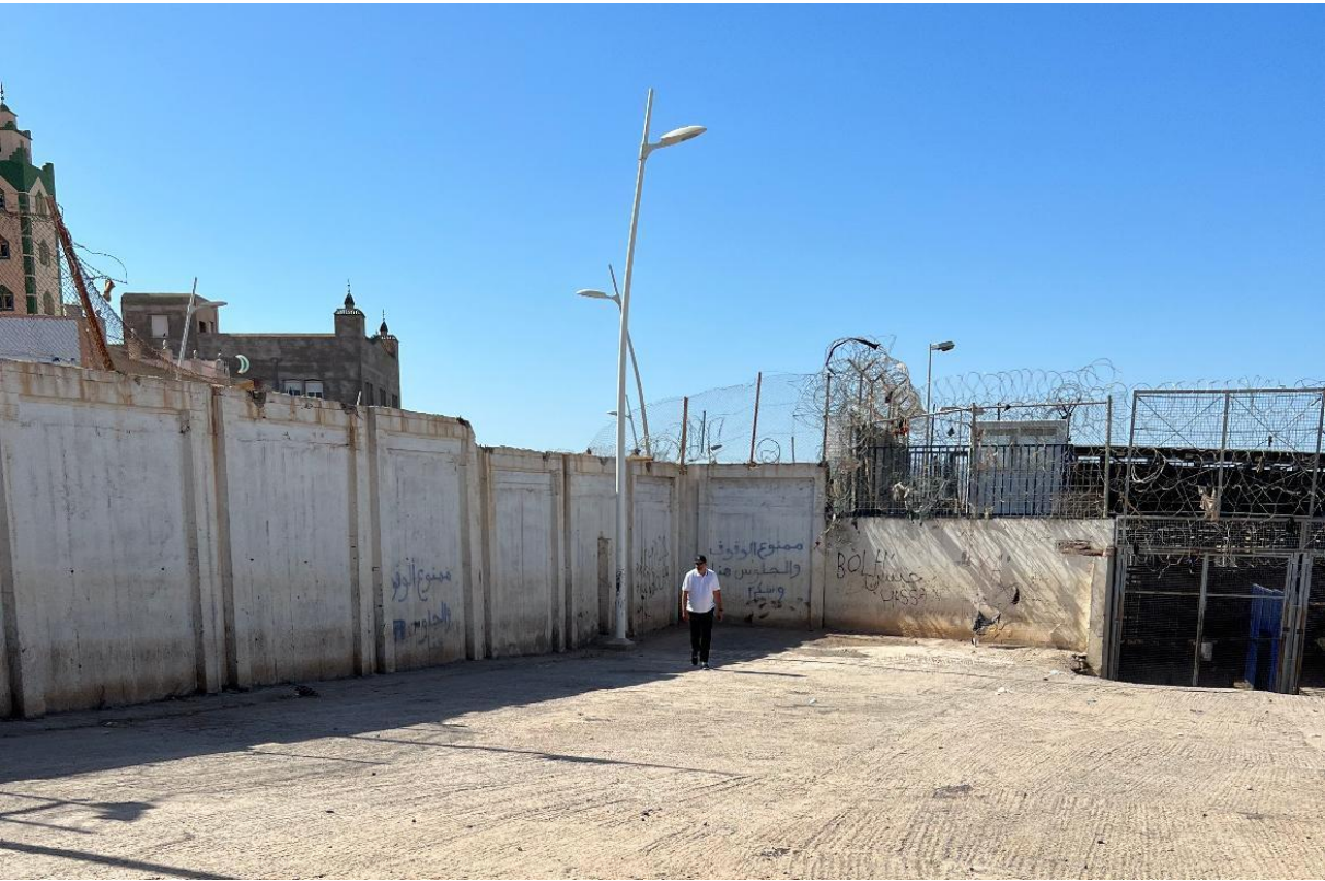
Imagen 4: La parte derrumbada de la verja que remata los muros del patio del paso