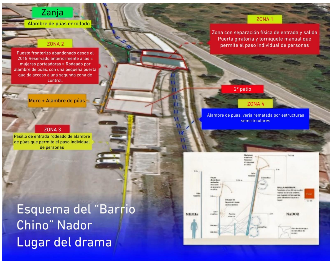
Gráfico N°1: Las cuatro zonas componentes del paso fronterizo « Barrio Chino », además de las características de la valla.

Durante su visita al paso, la Comisión observó la parte derrumbada de la verja que remata el muro del mismo. Observó también trozos de ropa, palos de madera y mochilas atorados en las púas espinosas que rematan las puertas y la valla.