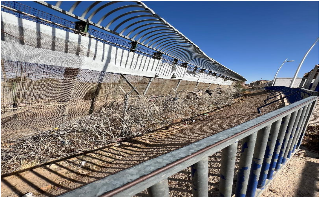
Imagen n°5: Zanja con alambre de púas que separa la plaza del paso de la valla de Melilla