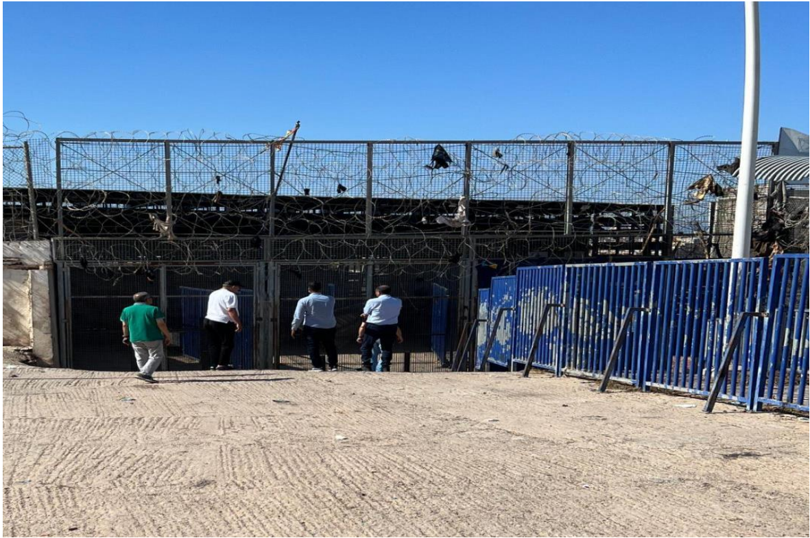
Imagen 1: Las puertas de la zona de separación rematada de verja que aún conlleva trozos de ropa.