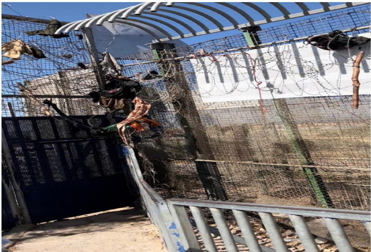
Imagen n°6: Trozos de ropa, palos de madera y mochilas atorados a las púas de alambre que remontan las puertas y la valla