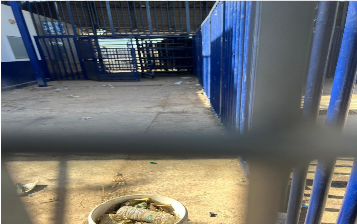
Imagen n° 3: Torniquete