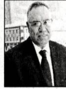
إلى قيمة جديدة دافعة للتنمية بدل العكس.

كانت هذه الدورة فرصة للتداول في الطريقة والآليات التي أعدت بها اللجنة الجهوية الزيارات التفقدية لمختلف السجون الموجودة بتراب الجهة، وكذا الزيارات التي تمت لمستشفيات الأمراض العقلية ومراكز حماية الطفولة.