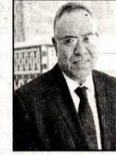
التقييم مع المقرر الخاص للأمم المتحدة المكلف بمبلغ التعذيب، ما هي القضايا التي أثرت خلال هذا اللقاء؟