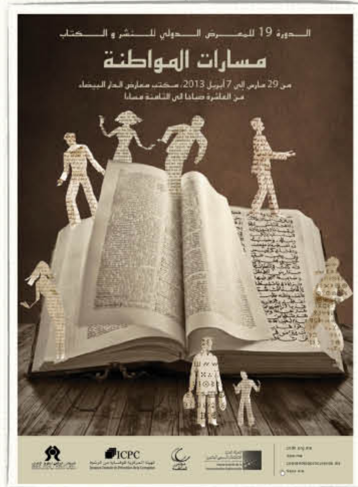
الدورة 19 - 2013 مسارات المواطنة