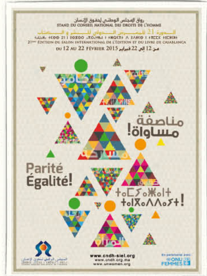
الدورة 21 - 2015 المناصفة والمساواة