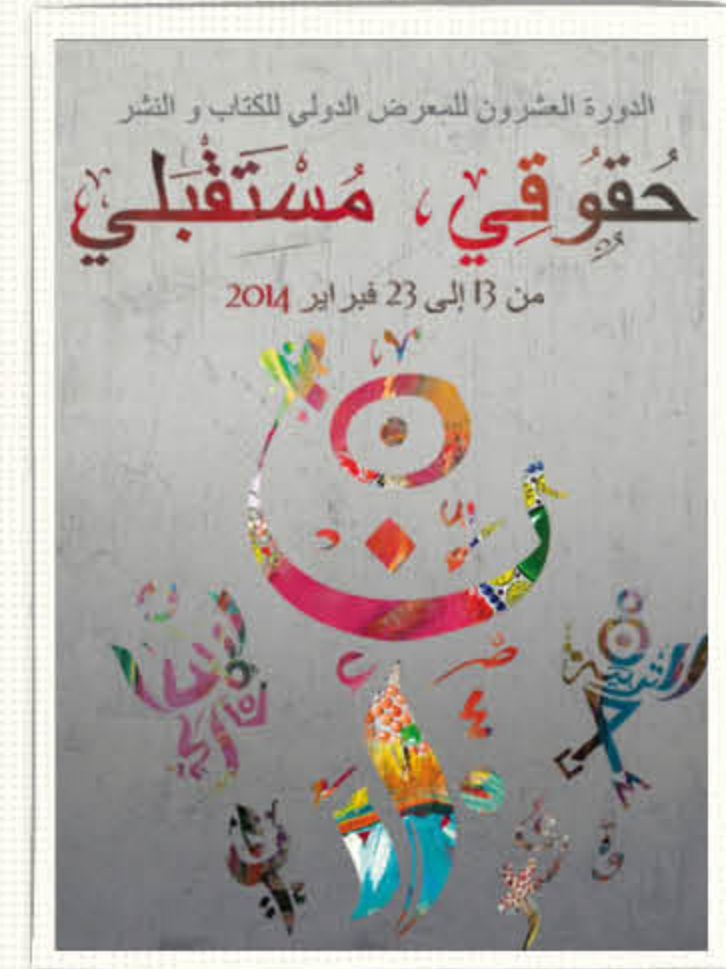
الدورة 20 - 2014 حقوقِي، مُستقبلي